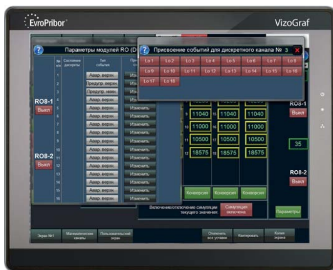
Рис. 4. Присвоение событий для дискретного канала

чаться» до конкретного VizoGraf V2.0 , находящегося в любой точке земного шара. Для этого необходимо приобретение ключа активации, все остальное сделают специалисты ООО «НПЦ «Европрибор».