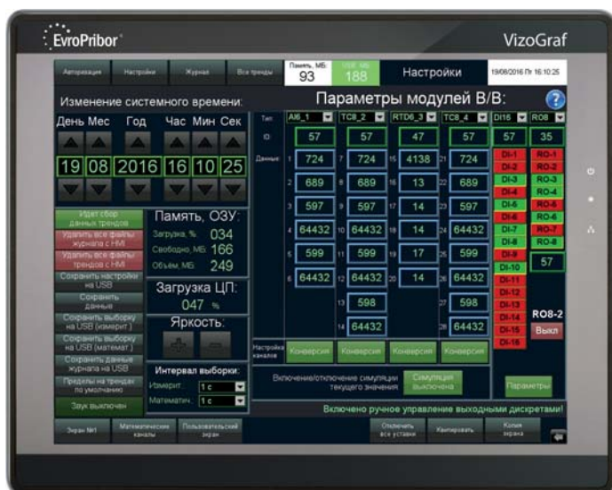
Рис. 3. Экран настройки VizoGraf V2.0