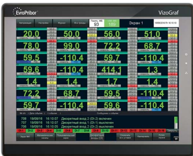
Рис. 1. Вид главного экрана VizoGraf V2.0 на 32 измерительных канала

2. С помощью технологии EasyAccess 2.0. Данная технология позволяет «досту-