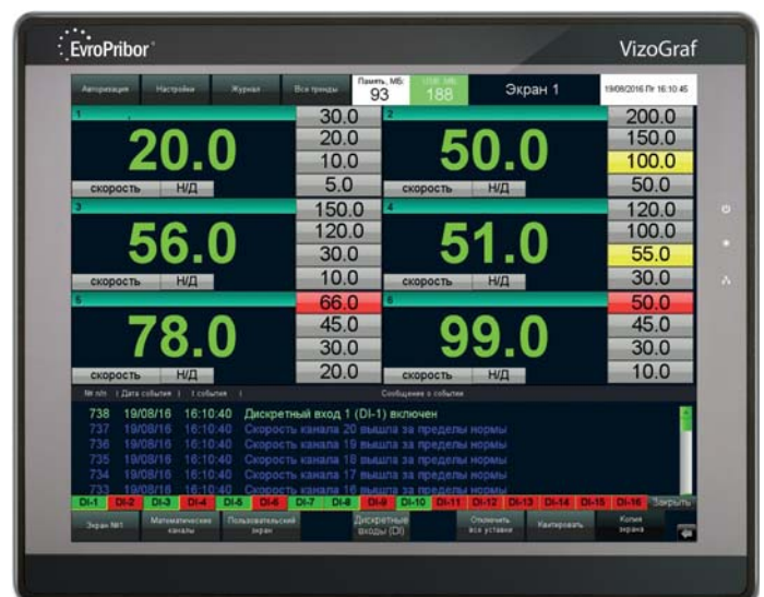
Рис. 2. Вид главного экрана VizoGraf V2.0 на 6 измерительных канала